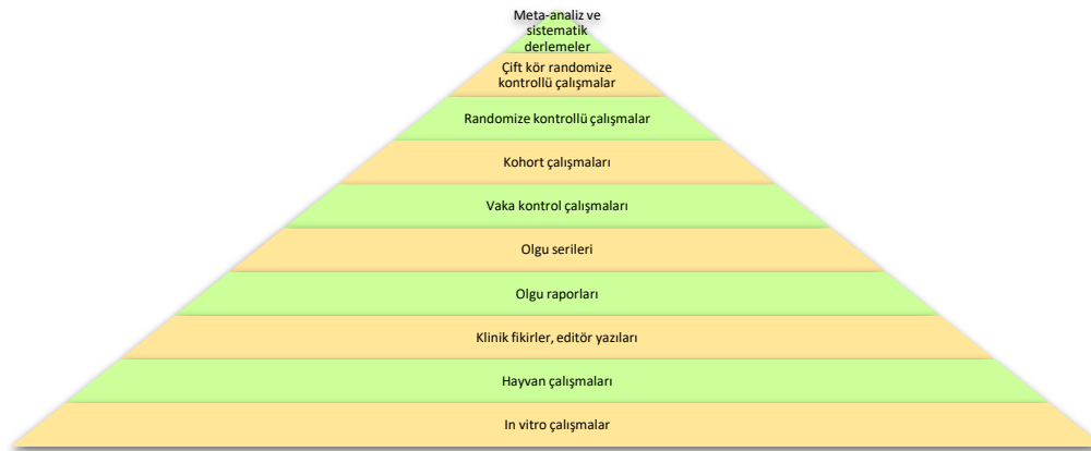
Şekil 1. Tıbbi kanıt piramidi 3,4

Kanıta dayalı tıptan yararlanarak tıbbi karar verebilmek için öncelikle araştırma sorusu oluşturulmalıdır. Araştırma sorusu araştırılan konu üzerine odaklanmalı ve net olmalıdır. Sackett ve arkadaşları, araştırma sorusunu baş harfleri PICO